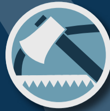
YXA OCH SÅG