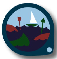
VARA UTE: VATTEN