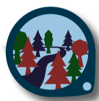
VARA UTE: SKOGEN