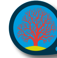
DÅ OCH NU