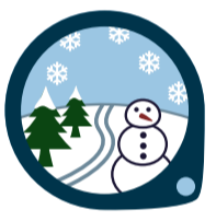
VARA UTE: VINTER