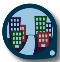
VARA UTE: STADEN