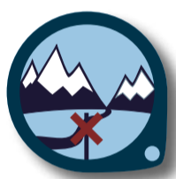
VARA UTE: FJÄLLEN